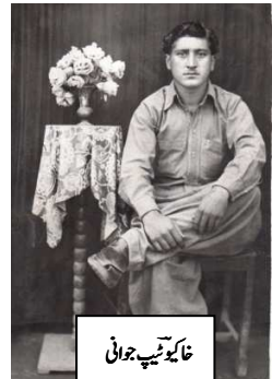
خاکبو نیچہ جوانی

فوجہ بغائے واپو کم جُو سال نوکری کوری تو غودی